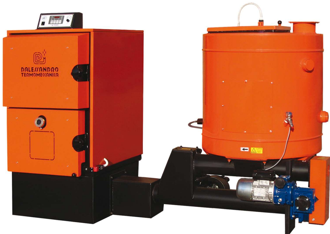
Kotao model CSA, korisna snaga od: 30, 45, 60, 80 i 100kW Električno napajanje 230V, 50Hz